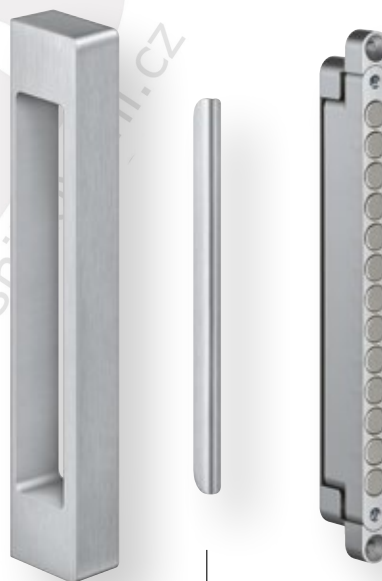
Madélko KC 17

Magnetický uzávěr, skládající se z uzavíracího magnetu KC 50 pro zárubeň a magnetického protiplechu KC 50/G a madélka KC 17 pro skleněné dveře, vytváří estetický celek. Všechny prvky jsou použitelné pro dřevěné, ocelové a hliníkové zárubně.