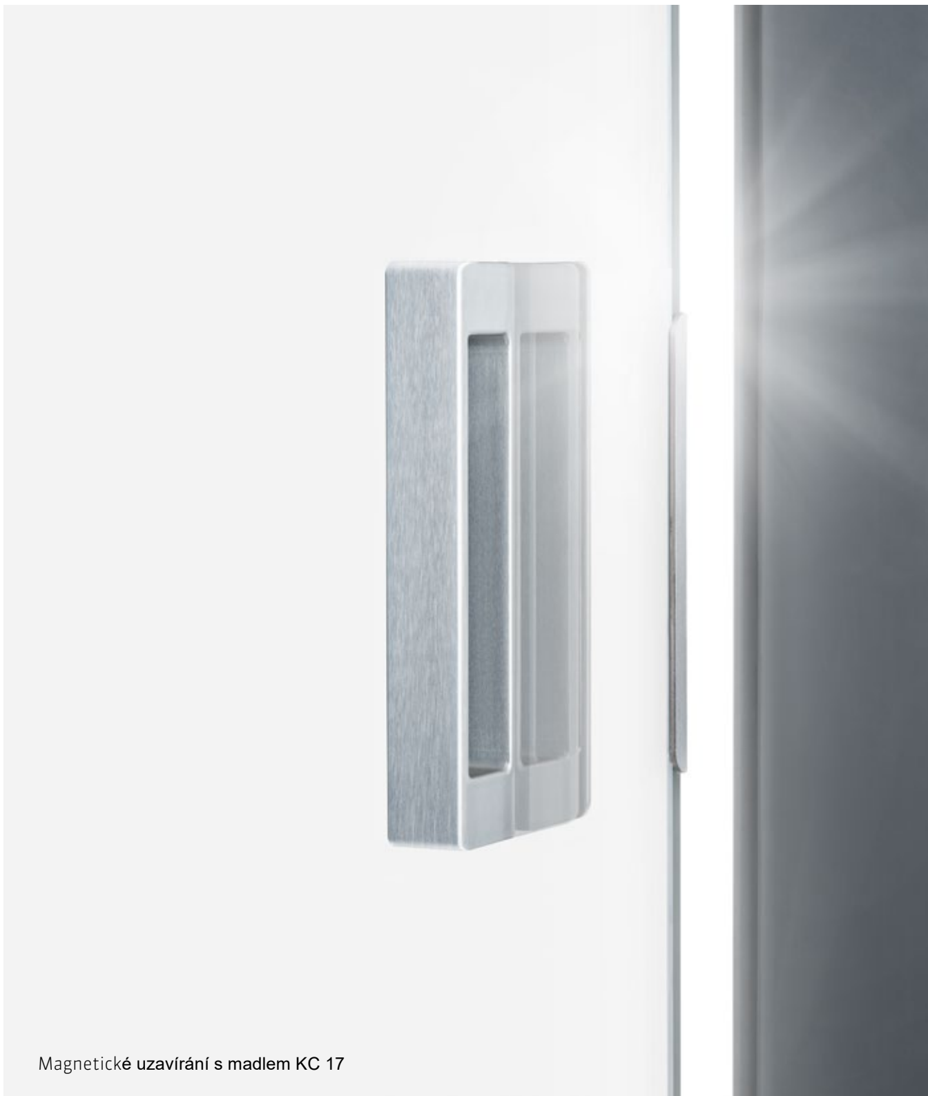
Magnetické uzavírání s madlem KC 17

Produkt lze zakoupit na www.luxusnikovani.cz