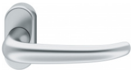
FSB 09 1023, klika na úzké rozetě