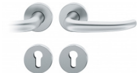
Kování FSB 12 1023 ASL