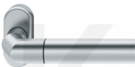
FSB 06 1078 odsazená klika, úzká rozeta

OD OD 1 311 Kč Termín bude prověřen u dodavatele