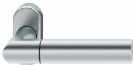
FSB 09 1078, klika na úzké rozetě