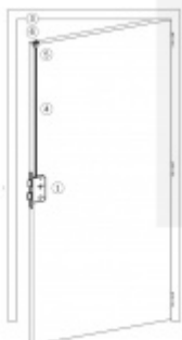
Stranové určení zámků SSF