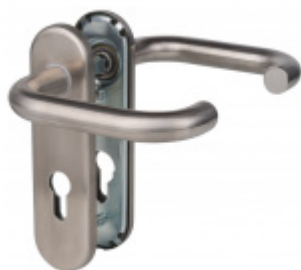
Štítkové kování Súdmetall Paula-KS