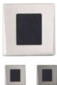
ÜControl RFID - čtečka, bateriová