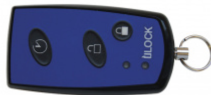
Dálkový ovladač ÜLOCK