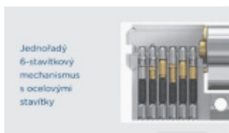
Jednořadý 6-stavítkový mechanismus s ocelovými stavítky