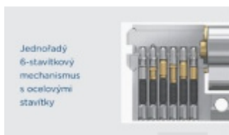
Jednořadý 6-stavítkový mechanismus s ocelovými stavítky