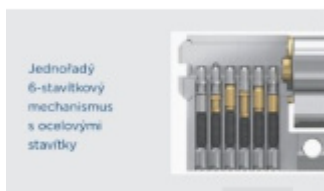
Jednořadý 6-stavítkový mechanismus s ocelovými stavítky