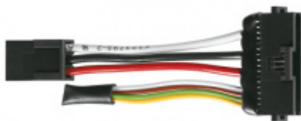
Adapter 1 Tectus Energy - Führ SIMONSWERK

OD 1 978 Kč Termín bude prověřen u dodavatele