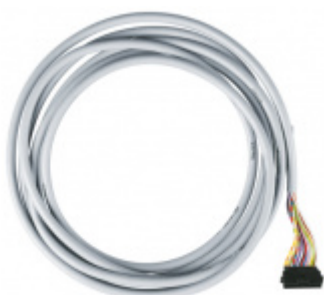
Kulatý kabel Tectus Energy SIMONSWERK

OD 1 978 Kč Termín bude prověřen u dodavatele