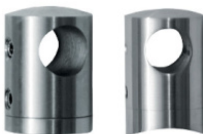
Držák tyče pro zábradlí