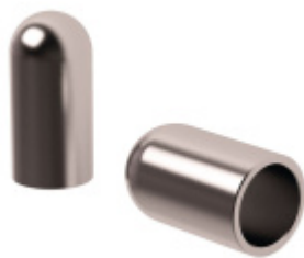
Koncovka na trubku, nerez