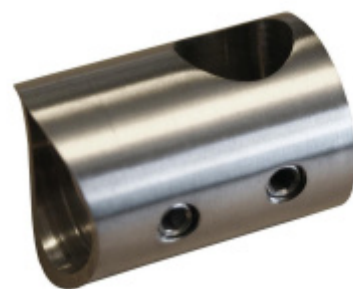
Koncovka tyče pro zábradlí