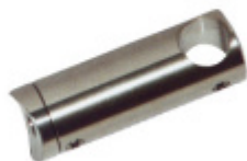
Držák tyče pro zábradlí, odsazený