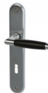
Štítkové kování Súdmetall Ton-LS, Variostar