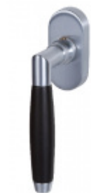
Okenní klika Súdmetall Ton