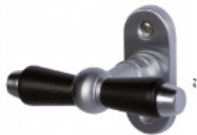
Okenní klika Súdmetall Ton, oliva