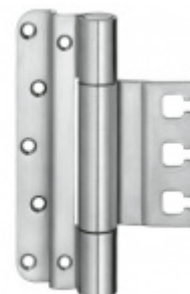
Simonswerk Variant VX 7859/160