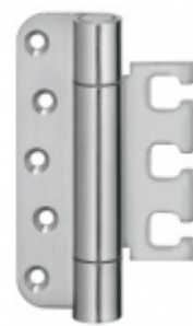
Simonswerk Variant VX 7728/120