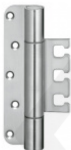
Simonswerk Variant VX 7728/160