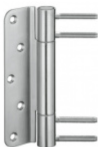
Simonswerk Variant VN 3948/160