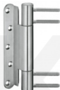
Simonswerk Variant VN 3938/160