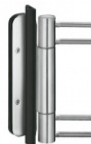
Simonswerk Variant VN 3938/160 FD