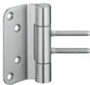
Simonswerk Variant VN 3949/100