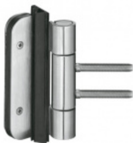
Simonswerk Variant VN 3939/100 FD