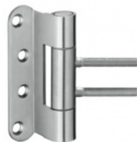
Simonswerk Variant VN 3939/100